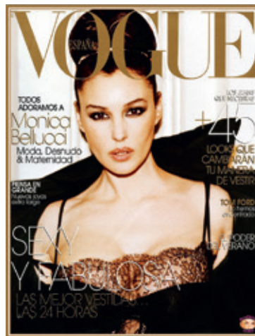
NÄITLEJA MONICA BELLUCCI Andrés Sardá pesus Hispaania Vogue'i kaanel.