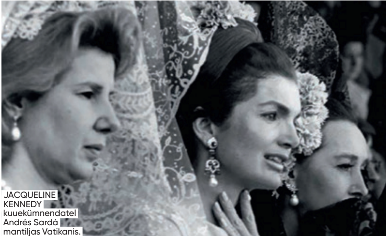
JACQUELINE KENNEDY kuuekümmendatel Andrés Sardá mantiljas Vatikanis.